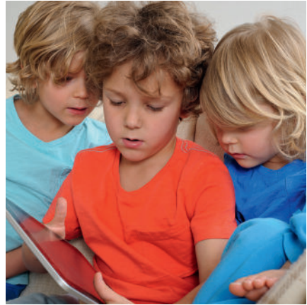
Tijdens het spelen raken de hoofden elkaar en kan hoofdluis zich verspreiden.

Hoofdluis heeft niets te maken met wel of niet schoon zijn. Het kan iedereen overkomen. Hoofdluizen lopen via het haar over van hoofd naar hoofd. Hoofdluizen zoeken graag een warm plekje op; bijvoorbeeld in het haar achter de oren, in de nek of onder een pony. Kinderen krijgen gemakkelijk hoofdluis, omdat tijdens het spelen de hoofden elkaar soms raken. Hoofdluizen verspreiden zich ook makkelijk bij pubers. Dat kan bijvoorbeeld gebeuren bij het knuffelen, samen selfies maken of bij elkaar op de mobiel kijken.